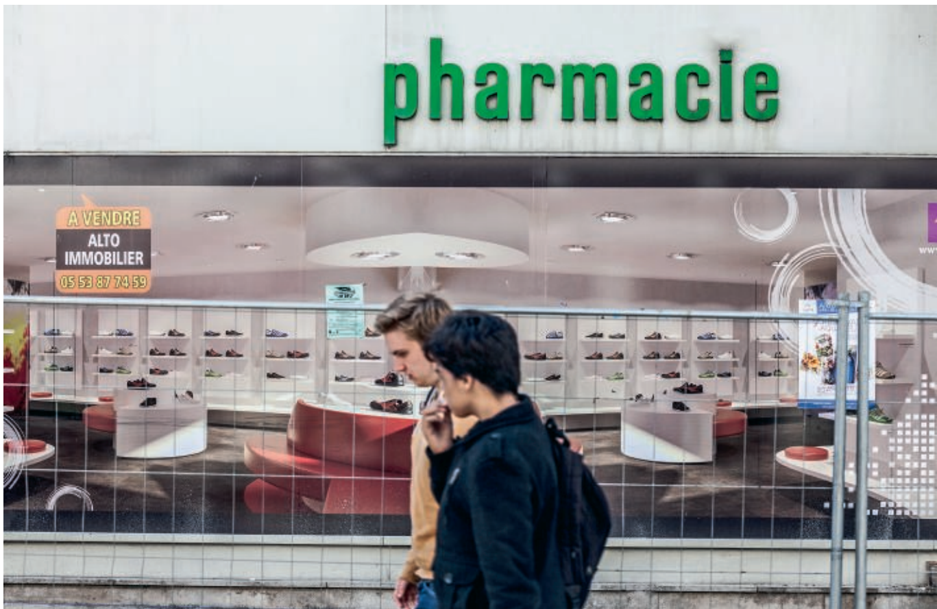
Un magasin de chaussures à Agen ? Non ! Une pharmacie fermée qui attend un repreneur, et dont la vitrine a été recouverte d'un autocollant géant.