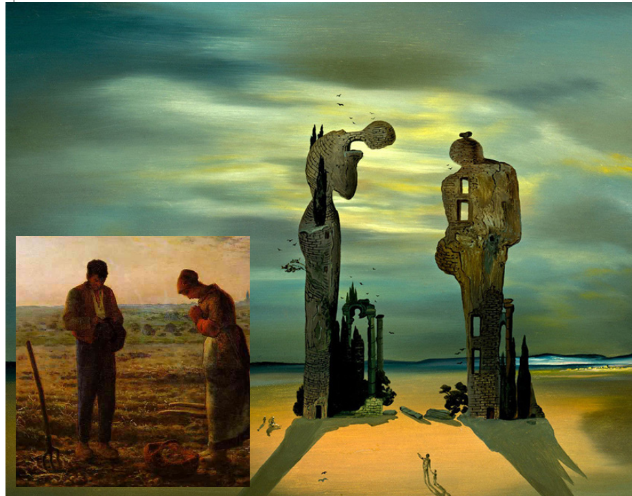
Deux angelus dans le temps : Millet et Dalí

ting», «la nourriture du peuple» était «sa sollicitude.» Il bataillera pour imposer cette culture nouvelle de la pomme de terre à force de... publications. Le développement agricole et la vulgarisation avant l'heure. Idem pour le Saintais Bernard Palissy, qui publia maints traités sur les engrais : «si la terre était cultivée comme elle devait l'être, elle produirait deux fois plus.» Des premiers écolos s'insurgeant contre une mau-