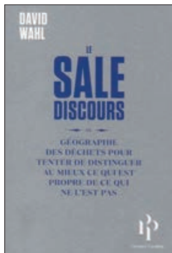
Le Sale Discours ou Géographie des déchets pour tenter de distinguer au mieux ce qui est propre..., par David Wahl, éd. Premier Parallèle, 80 pages, 10 euros.