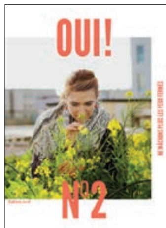
Oui! n° 2, Ne mâchons plus les yeux fermés, 128 pages, 15 euros.