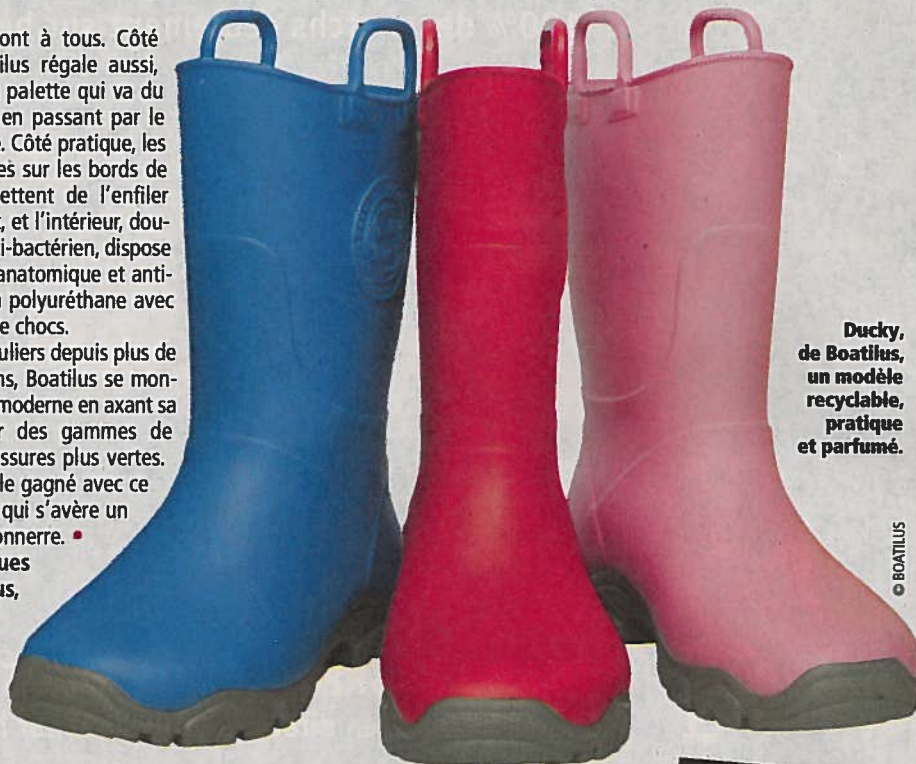
Ducky, de Boatilus, un modèle recyclable, pratique et parfumé.

Bottes nautiques Ducky, Boatilus, à partir de 15 €. www.boatilus.com