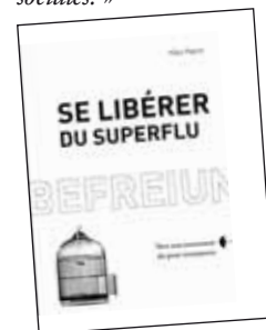
/ Se libérer du superflu , de Niko Paech, éd. Rue de l'échiquier, 122 p., 13 euros.

Un économiste peut-il imaginer un système décroissant ? L'Allemand Niko Paech y parvient dans son livre Se libérer du superflu , bien qu'il préfère parler d'économie « de post-croissance ». Avec des mots simples et une logique implacable, l'auteur dresse d'abord un constat : l'homme vit au-dessus de ses moyens, le « progrès » est illusoire, la « croissance verte » est un mythe. Vient ensuite le temps des propositions. Le lecteur trouvera la vision globale d'une nouvelle économie, tout en comprenant que cela passera par des gestes individuels du quotidien. Niko Paech prône par exemple « l'intensification de l'usage par le partage » : « Celui ou celle qui emprunte un objet usuel à un voisin, lui cuit son pain ou lui installe la dernière version de Linux, contribue à substituer à la production matérielle les relations sociales. »